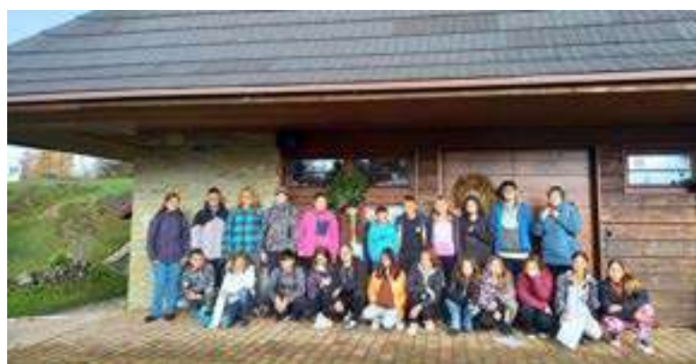
Výuka literatury – Zvonice Soláň