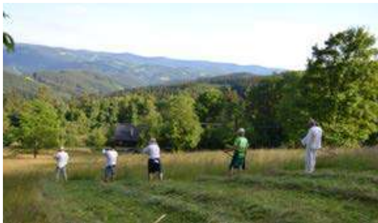
Sečení luk na Soláni