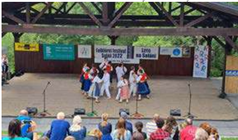
MFF Léto na Soláni, Janáček na Soláni