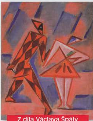
Z díla Václava Špála

■ ■ ■ SPÁLA, ČAPEK, FILLA, KUPKA... ve Zlíně. Expozice představuje obrazy, kresby a grafiku ZE SOKROMÉ SBÍRKY KARLA ČAPKA A OLYGY SCHEINPFLUGOVÉ , jež pochází z Čapkovy vily na pražských Vinohradech. Prezentovány jsou spolu s díly z pozůstalosti Emila Filly a souborem prací Františka Kupky. Jedná se o jedinečnou příležitost spatřit tato díla před aukcí, která se uskuteční v listopadu v Praze. Výstavu pořádá Krajská galerie výtvarného umění ve Zlíně ve spolupráci s Adolf Loos Apartment and Gallery. Grafický kabinet, 2. podlaží budovy; do 2. listopadu.