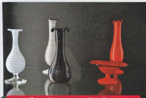
Z nového muzea v Karolince